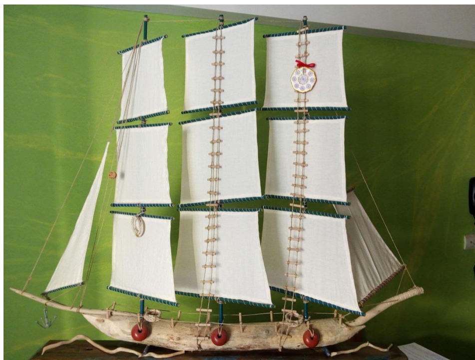
Καράβι (Χειροποίητη κατασκευή) Εμμ. Ψαρουδάκη, εκπαιδευτικού, κλάδου ΠΕ86, ΓΕ.Λ. Ν. Αλικαρνασσοῦ Ηρακλείου)

ΔΙΟΡΓΑΝΩΣΗ: ΙΩΑΝΝΑ Α. ΡΑΜΟΥΤΣΑΚΗ, ΣΥΝΤΟΝΙΣΤΡΙΑ Ε.Ε. ΦΙΛΟΛΟΓΩΝ ΤΟΥ ΠΕ.ΚΕ.Σ. ΚΡΗΤΗΣ, ΣΕ ΣΥΝΕΡΓΑΣΙΑ ΜΕ ΤΗΝ ΚΟΙΝΟΤΗΤΑ ΣΥΝΕΡΓΑΣΙΑΣ ΦΙΛΟΛΟΓΩΝ ΗΡΑΚΛΕΙΟΥ- ΛΑΣΙΘΙΟΥ ΑΡΜΟΔΙΟΤΗΤΑΣ ΤΗΣ (ΔΙΑΣΧΟΛΙΚΑ ΣΥΝΕΡΓΑΤΙΚΑ ΔΙΚΤΥΑ) ΚΑΙ ΤΟΝ ΕΚΠΑΙΔΕΥΤΙΚΟ ΚΛΑΔΟΥ ΠΕ02, κ. ΠΑΝΑΓΙΩΤΗ ΑΜΠΕΛΑ