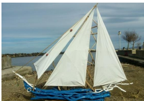
(Φωτογραφία και Χειροποίητη κατασκευή Εμμανουήλ Ψαρουδάκη, εκπαιδευτικού, κλάδου ΠΕ86, ΓΕ.Λ. Ν. Αλικαρνασσού Ηρακλείου)

Συντονισμός Συζήτησης: κ. Σωτηρία Μαρτίνου , Συντονίστρια Εκπαιδευτικού Έργου ΠΕ70 του ΠΕ.Κ.Ε.Σ. Κρήτης