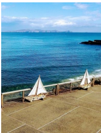
Φωτογραφία και χειροποίητη κατασκευή Εμμανουήλ Ψαρουδάκη, εκπαιδευτικού, κλάδου ΠΕ86, ΓΕ.Λ. Ν. Αλικαρνασσού