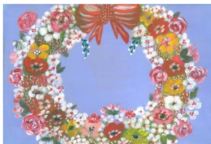
Ανοιξιάτικο στεφανάκι, Πίνακας Ζωγραφικής Χρυσούλας Ραμουτσάκη

2 η Ημέρα Συνεδρίου: Τρίτη, 2 Μαρτίου 2021