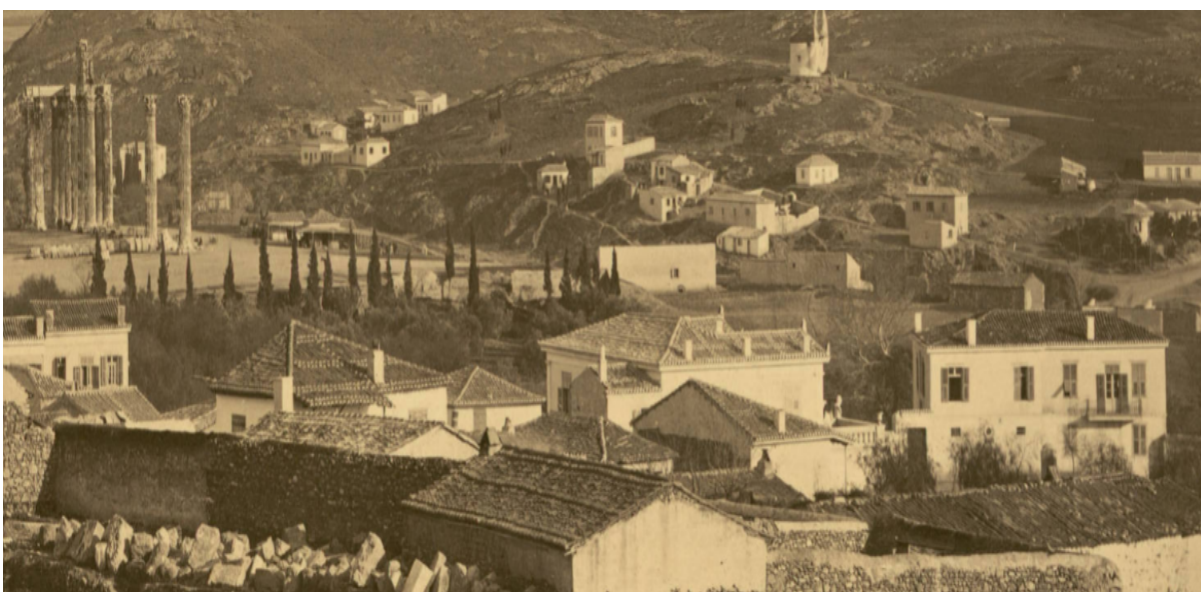
Εικόνα 2: Ο κήπος του Μακρυγιάννη διακρίνεται στο αριστερό μέρος της φωτογραφίας. (Granges, 1869)