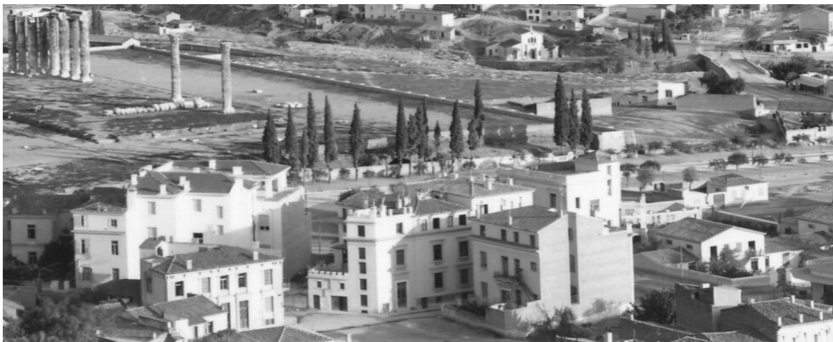
Εικόνα 5: Οι σπηλιές διακρίνονται πίσω από το τοίχιο που ανήγειρε η αρχαιολογική υπηρεσία. (Woodhouse,1910)

τῶν Ἀθηνῶν. Μάταιος κόπος! Ἡ πρόοδος καί ὁ πολιτισμός δέν μπορούσαν ν' ἀνεχθοῦν τήν ὑπαρξή μιᾶς σπηλιάς πού ἴσως νά μὴν εἶχε καμμιά γραφικότητα, θά γεννοῦσε ὁμως τόση περιέργεια, ὥστε καί τούς ἀνίδεους ἀκόμη θά τούς ἔκανε νά μάθουν μιά σελίδα τῆς ἱστορίας τοῦ τόπου πού δέν πρέπει ν' ἀγνοοῦν. Πάει λοιπόν καί ἡ σπηλιά... (Αγγελομάτης, 1937: 276-278)