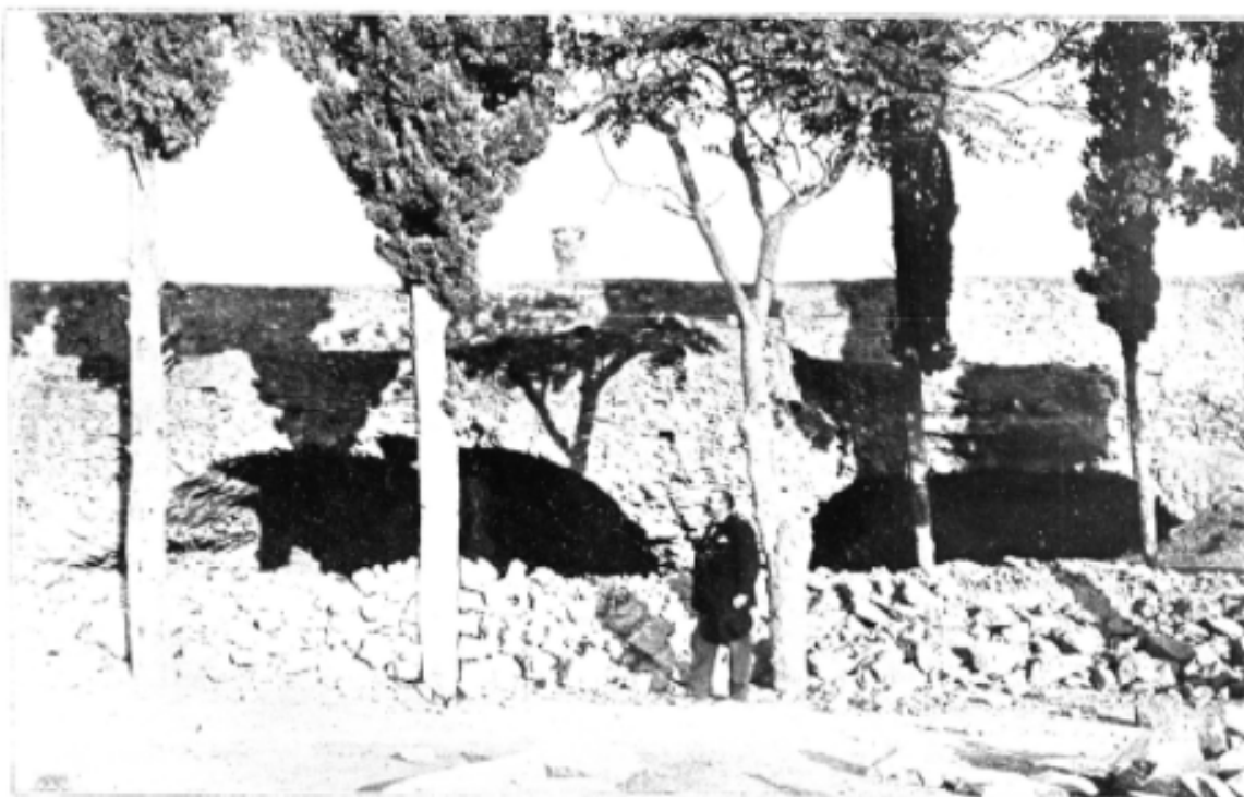
Η "ΣΠΗΛΙΑ.. ΤΟΥ ΜΑΚΡΥΓΙΑΝΝΗ (ἀριστοτέρ τῷ Θεωμένω).

[...] ή αρχαιολογική ύπηρεσία έχτισε κι αυτή τήν πλευρά τοῦ περιβόλου, αλλά καί πάλι—ίσως γιατί θέλησε νά προορίση τό ναό γιά καθαρά χώρο ἀρχαιολογικό—δέν ἄφησε πιά νά γίνει ἐκεῖ κανένα κέντρο κοινωνικό, οὔτε καί σχολικές ἀσκήσεις. Τέτοιο πνεῦμα φανατισμοῦ δασκάλικου βασίλευε [...]. Για τόν Ἕλληνα ἀρχαιολόγο δέν ὑπάρχει παρά ἀρχαιολογία καί τίποτε ἄλλο. (Βλαχογιάννης, 1950: 636)