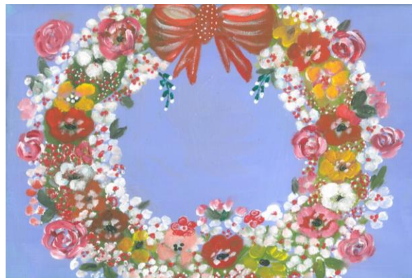
Ανοιξιάτικο στεφανάκι, Ζωγραφική: Χρυσούλας Ραμουτσάκη

ΙΩΑΝΝΑ Α.ΡΑΜΟΥΤΣΑΚΗ, ΣΥΜΒΟΥΛΟΣ ΕΚΠΑΙΔΕΥΣΗΣ ΦΙΛΟΛΟΓΩΝ, ΣΕ ΣΥΝΕΡΓΑΣΙΑ ΜΕ ΤΟ ΓΕΝΙΚΟ ΛΥΚΕΙΟ ΝΕΑΣ ΑΛΙΚΑΡΝΑΣΣΟΥ ΗΡΑΚΛΕΙΟΥ ΚΑΙ ΤΗΝ ΚΟΙΝΟΤΗΤΑ ΣΥΝΕΡΓΑΣΙΑΣ ΦΙΛΟΛΟΓΩΝ ΓΥΜΝΑΣΙΩΝ, ΓΕΝΙΚΩΝ ΚΑΙ ΕΠΑΓΓΕΛΜΑΤΙΚΩΝ ΛΥΚΕΙΩΝ ΗΡΑΚΛΕΙΟΥ ΑΡΜΟΛΙΟΤΗΤΑΣ ΤΗΣ