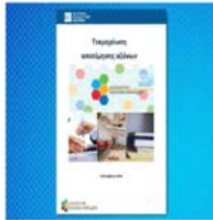
Τεχνική Οδηγία Αξιολόγησης Ανοίξτε το έγγραφο σε μορφή PDF.