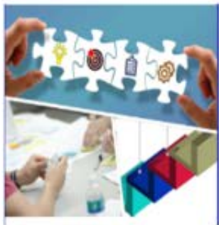
Σχεδίαση Δράσης - Προτάσεις Σχεδιασμού Ανοίξτε το έγγραφο σε μορφή PDF.

http://iep.edu.gr/el/odigoi-kai-ergaleia-m