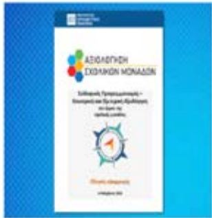
Οδηγός Αξιολόγησης Σχολικών Μονάδων Ανοίξτε το έγγραφο σε μορφή PDF.

Σε αυτή την κατηγορία μπορείτε να βρείτε οδηγούς για τις δράσεις και αξιολογούμενα εργαλεία ανάλογα με την βαθμίδα ή τον τύπο της σχολικής μονάδας σας.