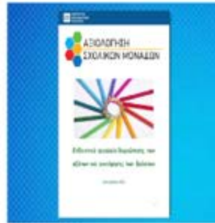
Ενδεικτικά εργαλεία διερεύνησης των θεματικών αξόνων και αποτίμησης των δράσεων Ανοίξτε το έγγραφο σε μορφή PDF.