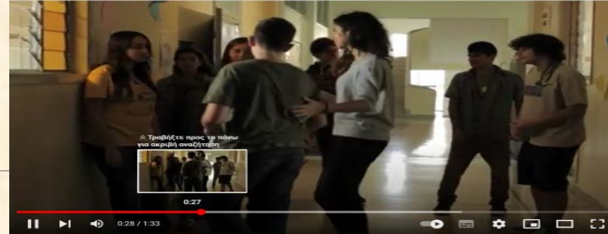
Παρεμβαίνει στο επεισόδιο

https://www.youtube.com/watch?v=wFU1E9uFizo&t=1s