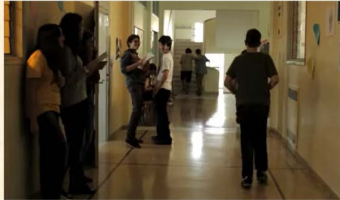
Ενθαρρύνει το παιδί που εκφοβίζει