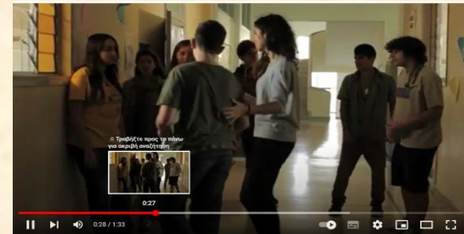
Παρεμβαίνει στο επεισόδιο