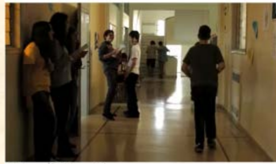
Ενθαρρύνει το ήσυχο παιδί που εκφοβίζεται