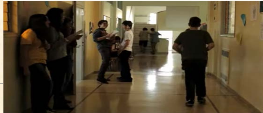
Ενθαρρύνει το παιδί που εκφοβίζει

https://www.youtube.com/watch?v=waT0sRadj4k&t=1s